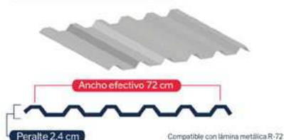
Lámina T-8 (R-72)*